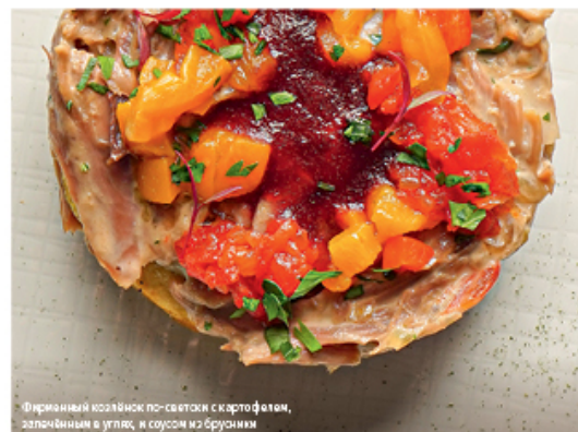
Фирменный козлёнок по-светски с картофелем, запечённым в углях, и соусом из брусники

и соусом из брусники (₽950), утка с пюре из багата, соусом из сливы и припушеным шинитом (₽750). Здесь очень вкусные, словно пуховые, пирожки, их тоже пекут в печи: с капустой, мясом, грибами, вишней (по ₽70).