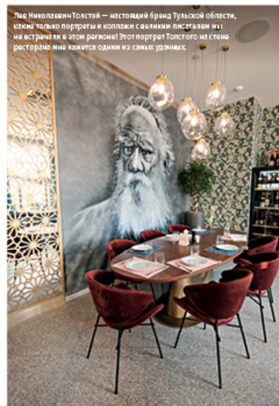
Лад Николаевич Толстой — настоящим брендом Тульской области, какому только портреты и копилки с его именем мы не встречаем в этом регионе! Этот портрет Толстого на стене ресторана мне кажется одним из самых удачных.

Пельмени ручной работы со свиной или бараньей — ₽350; чашка калачино — ₽150; эспрессо — ₽100