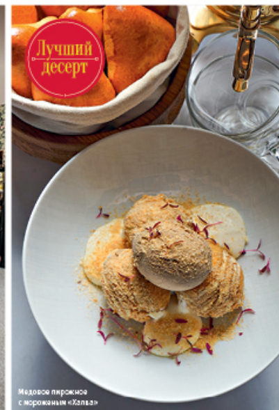
Медовое пирожко с мороженым «Халва»